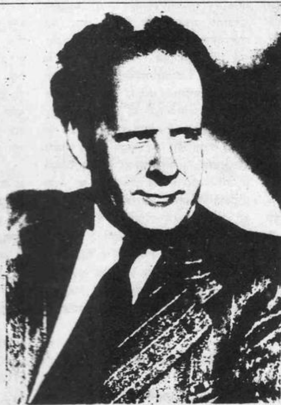
सेर्गेई मिखाइलोविच आइजेंस्टाइन

ये सारभूत चारित्रिकताएं एक पद्धति के साथ-साथ एक विचार को भी निर्मित करती है। एक ओर आइजेंस्टाइन विवरणात्मक फिल्म के पारम्परिक व्यवहार का सामना कर रहे थे, जिसका एकमात्र उद्देश्य दैनन्दिन जीवन के चित्र दिखाना था और दूसरी ओर वे अपने जीवन के अंतरतम लक्ष्य को व्यक्त कर रहे थे, जो फिल्म-विधा को अमूर्त, सामान्यीकृत बिम्बात्मकता की ऊंचाइयों तक ले जाना था। इस लक्ष्य को पाने का एकमात्र रास्ता उनके लिए यह हो सकता था कि वे अमूर्त विचार के सुस्पष्ट तर्कों का पक्ष लेकर कथा सूत्र को रद्द कर दें। इसी के अनुसार वे 'अक्टूबर' का मूल्यांकन करते हैं। "नाटक, कविता और बले के बाद अक्टूबर एक नया रूप प्रस्तुत करता है : विषय-वस्तुओं की श्रृंखला पर आधारित निबंधों का संग्रह।" दूसरे शब्दों में, यह एक चिन्तन फिल्म है। इसका तनाव वाद और प्रतिवाद की पारस्परिक क्रियाओं में रहता है और वह एक ऐसे सत्य से संसक्त रहता है जो दृष्टि-युक्तियों को नूतन और विशिष्ट बनाते हुए उनका बौद्धिकीकरण और पुनर्मूल्यांकन करता है। आइजेंस्टाइन का सपना यह है कि वे एक सिनेमाई निबंध, हस्तक्षेप या शोध-प्रबंध की रचना करें। तब क्या इस योजना के साथ हमारा हल्का बर्ताव न्यायसंगत है? बिल्कुल नहीं। आइजेंस्टाइन का साफ मतलब पूंजी का उपयोग अपने ऑपेरा-पाठ की तरह करना था; ऐसा आधार, जिस पर वे अपनी विचार-संरचनाओं