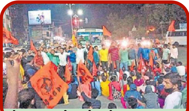
కేయూ కూడలిలో ఆందోళన చేస్తున్న విద్యార్థులు

కాకతీయ యూనివర్సిటీ: కేయూ యూనివర్సిటీలో సెల్స్ షైనాన్స్ కోర్సుల విద్యార్థులకు వసతిని ఎత్తివేస్తూ అధికారులు తీసుకున్న