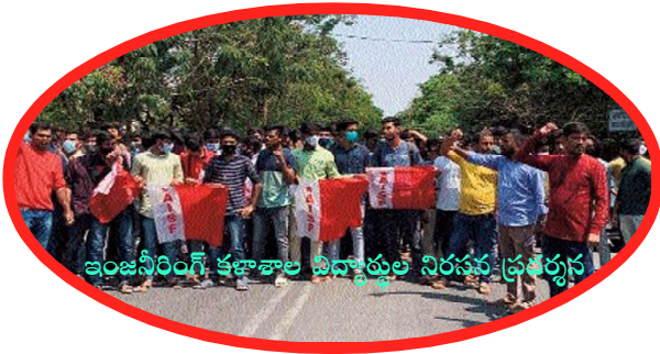
ఇంజనీరింగ్ కళాశాల విద్యార్థుల నిరసన ప్రదర్శన

హైదరాబాద్: ఓయూలో నెలకొన్న సమస్యలను పరిష్కరించాలని యూనివర్సిటీ అభివృద్ధికై రాష్ట్ర బడ్జెట్ లో వెయ్యి కోట్లు కేటాయించాలని డిమాండ్ చేస్తూ ఇంజనీరింగ్ కళాశాల విద్యార్థులు నిరసన ప్రదర్శన