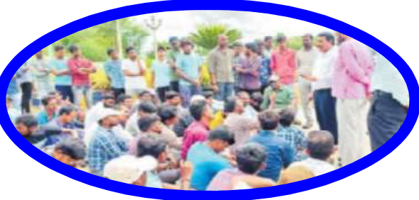
పాలమూరు యూనివర్సిటీ గేటు వద్ద ధర్నా చేస్తున్న విద్యార్థులు

మహబూబ్ నగర్ లోని పాలమూరు యూనివర్సిటీలో మౌఖిక వసతులు కల్పించకుండా అధికార యంత్రాంగం నిర్లక్ష్యంగా వ్యవహరిస్తుండడంతో యూనివర్సిటీలో తక్షణమే మౌఖిక వసతులు కల్పించాలంటూ విద్యార్థులు పెద్ద ఎత్తున యూనివర్సిటీ మేన్ గేటు వద్ద ధర్నాకు దిగారు. తమ డిమాండ్లను పరిష్కరించాలని నినదిస్తూ ఆందోళన కొనసాగించారు. హాస్టల్ గదులకు తలుపులు, కిటికీలు అమర్చాలని, ఫ్యూరిఫైడ్ వాటర్ ఫ్లాంట్ ను బాగు చేయించాలని, హాస్టల్ కి