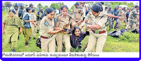
కోముసోపగూడలో అదివాసీ మహిళను ఈడ్చుకుంటూ తీసుకెళ్తున్న పోలీసులు

కారణంగా తాత్కాలికంగా వేసుకున్న గుడెసెలను ఖాళీ చేయించడం కోసం అటవీ అధికారులు, పోలీసులు అక్కడ నివసిస్తున్న ప్రజలపై దౌర్జన్యం చేసి వారిని ఇష్టం వచ్చినట్లు కొట్టి మహిళల పట్ల అత్యంత అమానవీయంగా ప్రవర్తించారు. విపరీతంగా కొట్టడం, ఈడ్చివేయడం, బూతులు తిట్టడం సీచాతి నీచంగా పోలీసులు వ్యవహరించారు. దీనితో ఆగ్రహించిన మహిళలు కారంపాడి, కర్రలతో పోలీసులపై తిరగబడ్డారు.