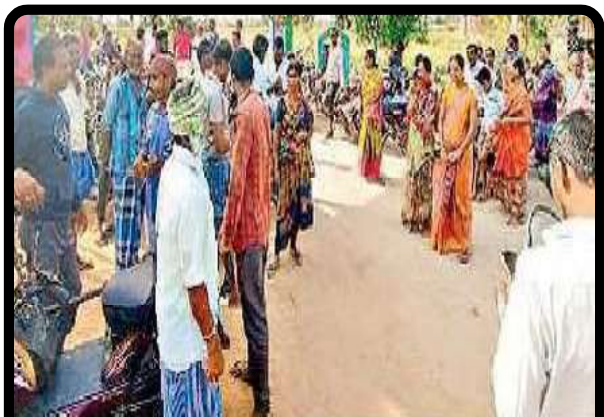
ఆందోళనకు దిగిన రైతులు

ఎల్లారెడ్డిపేట: కొనుగోలు కేంద్రాల నుంచి ధాన్యాన్ని మిల్లులకు తరలించకపోవడంతో రైతులు ఎల్లారెడ్డిపేట తహసీల్దార్ కార్యాలయం ఎదుట ధర్నా నిర్వహించారు. కొనుగోలు కేంద్రాల్లో గత పది రోజులుగా తూకం వేసిన ధాన్యం బస్తాలను రైస్ మిల్లులకు తరలించడంలో తీవ్ర జాప్యం జరుగుతోందని ఆరోపించారు. దీంతోపాటు కొనుగోలు కేంద్రాల్లో 40 కిలోల బస్తాకు 3 కిలోల ధాన్యాన్ని అదనంగా తూకం