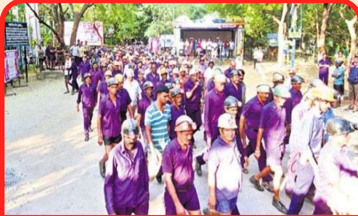
సమ్మెలో పాల్గొన్న కార్మికులు

8. ఇండియన్ లేబర్ కాన్ఫరెన్స్ సిఫారసులకు అనుగుణంగా కనీస వేతనం 21,000 గా నిర్ణయించాలి. వంటి డిమాండ్లను ప్రచారం చేశారు.