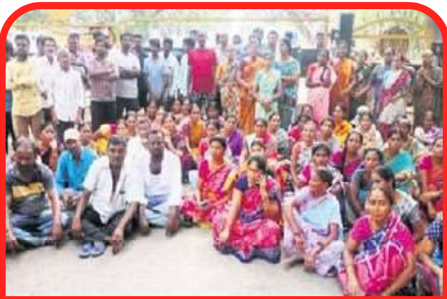
ఓసీపీ-2లో గేటు ఎదుట ధర్నా చేస్తున్న నిర్వాసితులు

రామగిరి: రామగిరి మండలంలోని లద్దాపూర్ గ్రామంలో అర్ధరాత్రి పోలీసు బలగాలతో సింగరేణి యాజమాన్యం నిర్వాసితుల