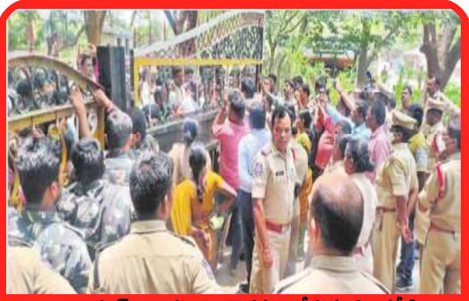
లద్దాపూర్ నివాసులపై దౌర్జన్యం చేస్తున్న సింగరేణి

తె లంగాణ వచ్చినంత ఓపెన్ కాస్టులుండవని చెప్పిన కేసీఆర్ ఇప్పుడు ఆ ఊసే ఎత్తడం లేదు. గోదారికి ఇరువైపులా వున్న పల్లెలను మట్టి దిబ్బలుగా మార్చే ఓపెన్ కాస్టులకు పరిష్కం ఇస్తానే, మరో వైపు ఓసీలు తవ్వతూ హరితహారం పేరుతో వందల, వేల మంది ప్రజలు వున్న గ్రామాలను చిన్నాభిన్నం చేస్తూ నాశనం చేస్తున్నారు. ఇలా పర్యావరణాన్ని నాశనం చేసి సంపాదించింది ఎంత? అని అక్కడి ప్రజలు ప్రశ్నిస్తున్నారు. మహా అయితే 500 కోట్లు. దీని కోసం అక్కడి పర్యావరణాన్ని దెబ్బతీస్తూ, ప్రజలున్న పల్లెలను తరుముతూ 500 కోట్ల కోసం ఇంత విధ్వంసం చేయాల్సిన అవసరం వుందా? ప్రత్యేక తెలంగాణ ఉద్యమ నాయకునిగా కేసీఆర్ చెప్పిన మాటలు ఏమై పోయాయని పల్లెలు అడుగుతున్నాయి. బొగ్గు ద్వారానే కరెంట్ ఉత్పత్తి ఆధారపడి వుందా? వేరే ప్రత్యామ్నాయ మార్గాలు లేవా?