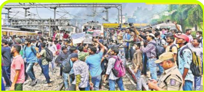
సికింద్రాబాద్ రైల్వే స్టేషన్ రైలు పట్టాలపై ఆందోళన చేస్తున్న యువకులు

అగ్నిపథ్ పథకాన్ని తీసుకొచ్చారు. బ్రాహ్మణీయ హిందూత్వ మోడీ ప్రభుత్వం నిరుద్యోగ యువతను మోసం చేస్తూ సైన్యాన్ని ప్రైవేటీకరించే దానిలో భాగంగా తీసుకువచ్చిన నాలుగేళ్ళ అగ్నిపథ్ స్కీమ్ను వ్యతిరేకిస్తూ నిరుద్యోగ యువత దేశ వ్యాప్తంగా కత్మీరు నుంచి కన్యాకుమారి వరకు ఆందోళనలు చేపట్టి రైళ్ళను, బస్సులను దగ్ధం చేశారు. రోడ్లను దిగ్బంధించారు. రైల్వే స్టేషన్లలో నిలిచి వున్న డజనుకుపైగా రైళ్ళను ధ్వంసం చేశారు.