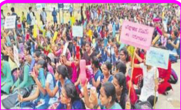
ఉత్తమ ప్రతిభ గేటు ఉత్త వాటర్ లాక్కుతో నిరసన తెలుపుతున్న విద్యార్థులు

భాసర ట్రీపుల్ ఐటీలోని సమస్యలన్నీ పరిష్కరించాలని 8 వేల మంది విద్యార్థులు తరగతులు బహిష్కరించి ఆందోళనలు చేపట్టారు.