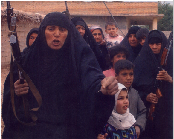
“అమెరికా సైన్యాల మా దేశం వదిలిపోవాల”ని నినదస్తూ తమ పిల్లలపాపలతో పాటు సాయుధ ప్రదర్శనలో పాల్గొంటున్న ఇరాకీ మహిళలు

అయినప్పటికీ ఇరాకీయుల ప్రతిఘటన అప్రతిహతంగా సాగుతూనే ఉంది. ఎట్టి పరిస్థితిలోనూ తమ గడ్డపై విదేశీ సైన్యాలండగూడదని దేశభక్తిపరులైన ఇరాకీయులు నినదిస్తున్నారు. విశ్వవిద్యాలయాల ఆవరణలో ప్రతిరోజూ కరపత్రాలు పంచడం, సామ్రాజ్యవాద వ్యతిరేక నినాదాలు చేయడం వాళ్లలో గల దేశాభిమానాన్ని చాటుతున్నాయి. ఇరాకీయులు తమ ఇంట్లనే బంకర్లుగా, శరీరాల్నే బాంబులుగా మార్చి శత్రువుతో తలపడుతున్నారు. అమెరికాకు మద్దతునిచ్చిన దేశాల దౌత్య కార్యాలయాలనూ, ఆఖరుకు పదేళ్లకు పైగా అమానవీయమైన ఆంక్షల్ని అమలు చేయించి తమ దేశాన్ని వినాశనం అంచులకు తేవడంలో అమెరికన్ సామ్రాజ్యవాదులకు పనిముట్టులా ఉపయోగపడిన ఐక్యరాజ్య సమితి కార్యాలయాన్ని కూడా వాళ్లు వదల లేదు. ఇరాక్ గెరిల్లాలు దాడి జరిపి అమెరికన్ సైనికుల్ని చంపి పడేస్తే నిమిషాల్లో అక్కడికి చేరుకున్న ప్రజలు వాళ్ల శవాలను కాళ్లతో తన్నిన ఘటనలూ, గెరిల్లాలు పేల్చేసిన వాహనాల పైకి ఎక్కి గంతులేస్తూ సంతోషాన్ని వెలిబుచ్చుతున్న ఘటనలూ వాళ్ల మనసులలో రగులుతున్న విద్వేషాన్ని వ్యక్తీకరణలు మాత్రమే. జోర్డాన్ రాయబార కార్యాలయంపై ఆత్మాహతి దాడి జరిగి భవనం చాలా వరకు దెబ్బతినిపోగా వెంటనే వందలాది మంది ప్రజలు అందులోకి జొరబడి అక్కడ ధ్వంసం కాకుండా మిగిలిపోయిన జోర్డాన్ రాజు చిత్రపటాన్ని కింద పడేసి తొక్కిడం వాళ్ల ఉన్నత స్థాయి రాజకీయ చైతన్యానికి ఒక ఉదాహరణ. ఇరాక్ పై దురాక్రమణను జోర్డాన్ రాజు సమర్థించినందుకు ప్రజలు వాడిపై కసితో రగిలిపోతున్నారు.