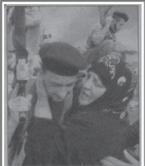
బాగ్దాద్ లో అమెరికన్ బ్యాంకును పడగొట్టిన ఇరాకీ సైనికుణ్ణి అభినందిస్తూ సంతోషాన్ని వెల్లబుచ్చుతున్న ఒక ఇరాకీ మహిళ

దురాక్రమణ బలగాలకు వ్యతిరేకంగా సాగించిన విముక్తి యుద్ధాన్ని గుర్తుకు తెస్తున్నాయి. సామ్రాజ్యవాదం పైకి ఎంత బలమైందిగా కనిపించినప్పటికీ అది నిజానికి కాగితపు పులేసని మావో మహాశయుడు చెప్పిన సత్యాన్ని ప్రపంచ ప్రజలంతా గ్రహిస్తున్నారు.