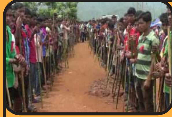
కటాఫ్ ఏరియా మిలిషియా కామ్రేడ్స్ [ఏ.ఓ.బి]