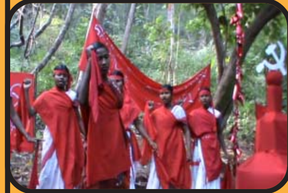
జి.ఎన్.ఎస్ [గ్రోనా నాట్స్ సెంఘ్] కామ్రేడ్స్ ప్రధర్షన [ఏ.ఓ.బి]