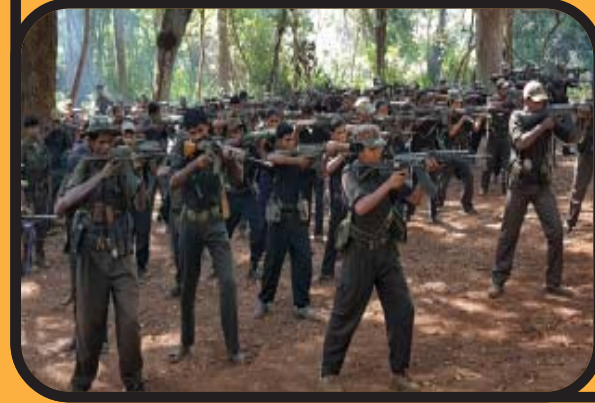
ప్రజా విముక్తి గెరిల్లా సైనిక యేధులు/ యేధులు