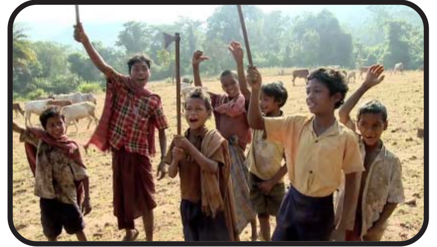
దండకారణ్య భూలల సంఘం

మధ్యాహ్నం సయమం. అప్పటివరకు కురిసిన కుండపోత వర్షం ఆగిపోవడంతో, నిశబ్దం సంతరించుకుంది. అప్పటికే కురిసిన వర్షాలతో చిగురిస్తున్న ఆకులు, వర్షపు చినుకులతో మెరుస్తున్నాయి. గుంపులు గుంపులుగా పక్షులు నింగిలో విహరిస్తున్నాయి. పార్టీ ఆధ్వర్యంలో భూస్వాములకు వ్యతిరేకంగా పోరాడి సాధించుకున్న భూముల్లో, ఎర్రజెండాలు స్వేచ్ఛగా ఎగురుతున్నాయి. తిరిగి వెళ్ళాల్సిన ఊరివాళ్ళ నడక ఆగింది. పక్కకి తల తిప్పగానే నాన్న చివరిసారిగా అన్నట్లు లాల్ సలామ్ చెప్పా. “పేద పీడిత ప్రజల విముక్తి కోసం ఊపిరున్నంత వరకు ప్రజల పక్షానే నిలబడతా”నని ప్రజల ముందు చేసిన వాగ్దానం, నాన్న చెప్పిన మాటలు గుర్తొచ్చాయి. అప్పటికే అటువైపొచ్చిన దళం మా కోసం ఎదురు చూస్తోంది, వెళ్ళే సమయం అయ్యిందన్నట్లు. మున్నాదాద దళం నుండి లిప్తపాటి చూపు. వెంటనే నాన్నిచ్చిన కేప్ తుపాకీ భూజాన వేసుకొని, మాలి కొండలవైపు కదులుతున్న దళంలో కలిసిపోయా. ✨