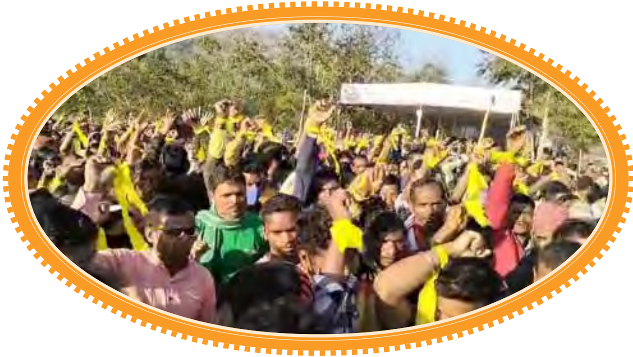
కొరాపుట్ జిల్లాలోని మాలి వర్షతం ఖనిజ నిక్షేపాల తవ్వకాల అనుమతులకు వ్యతిరేకంగా కదంతాక్కిన ప్రజానీకం

దూకుడుగా అమలు చేస్తున్నాయి. నేడు సామ్రాజ్యవాదం, దేశీయ దళారీ, బూర్జువావర్గం దేశంలోని వనరులనూ, మార్కెట్లను చిత్తానుసారంగా దోచుకుంటున్నారు. ఒడిశా రాష్ట్రంలో పుష్కలంగా ఉన్న అత్యంత విలువైన ఖనిజ సంపదను అంతర్జాతీయ, బహుళజాతి సంస్థలు, దేశీయ కార్పొరేట్ సంస్థలకు అప్పనంగా అప్పగించి దోచుకోవడానికి నవీన్ ప్రభుత్వం ఎర్ర తివాచీలు పరుస్తున్నది. వారి పెట్టుబడులను ఆకర్షించడానికి రాష్ట్రంలో అవసరమైన మౌలిక సదుపాయారోడ్లు, విమానాశ్రయాలు, నీళ్ళు, కరెంటు సరఫరా వ్యవస్థ, కమ్యూనికేషన్స్)లను అభివృద్ధి పరుస్తున్నది. ఫలితంగా రాష్ట్రంలోని లక్షలాది మంది ఆదివాసీల సాగుభూములు, నివాస స్థలాలు కోల్పోయి నిర్వాసితులుగా మారుతున్నారు. కొరాపుట్ జిల్లాలోని దేవమాలి వర్షతంలో అల్యూమినియం, బాక్సైట్ ఖనిజాలను తవ్వి తీసుకుపోవడానికి ఇండాల్కోకంపెనీలో ప్రభుత్వం ఒప్పందం చేసుకొని అనుమతులు ఇచ్చింది. దానివల్ల ప్రభావితమయ్యే 4 పంచాయితీలకు చెందిన వేలాది మంది ప్రజలు 'మాలిసురక్షాసమితి' అని పోరాట సంఘాన్ని నిర్మించుకొని గత 20 సంవత్సరాలుగా ప్రభుత్వం ఎన్ని కుట్రలకూ, కుహకాలకూ, సాయుధ అణచివేతకు దిగినా, రాజీ పడకుండా సంఘటితంగా, సమరశీలంగా తమ ఉద్యమాన్ని