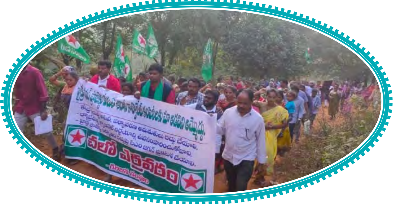
హైద్రాబాద్ ప్రాజెక్టు నిర్మాణానికి వ్యతిరేకంగా ఉద్యమిస్తున్న అల్లారి జిల్లా ప్రజలు