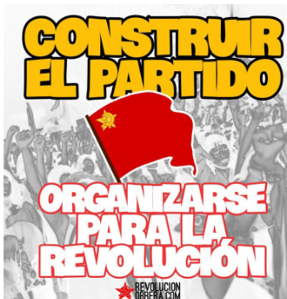
V.I. Lenin Carta a un camarada